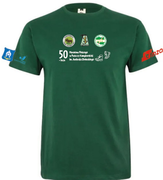
Koszulka zielona lub żółta bawełniana Dostępne rozmiary: