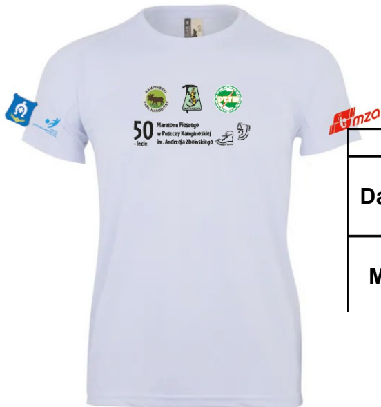
Koszulka biała poliestrowa Tabela rozmiarów: